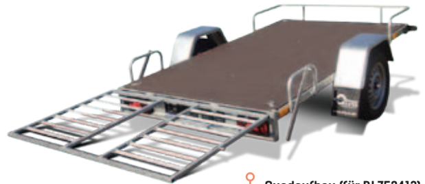
Quadaufbau (für BL752413)