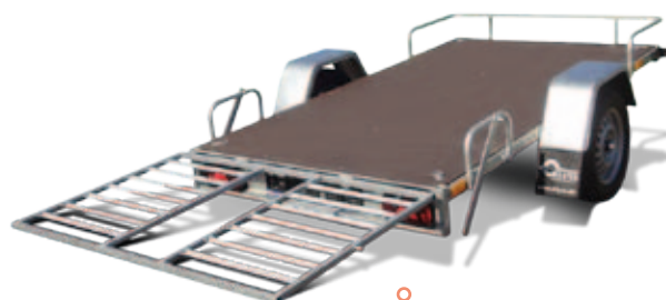
Quadaufbau (für BL752413)