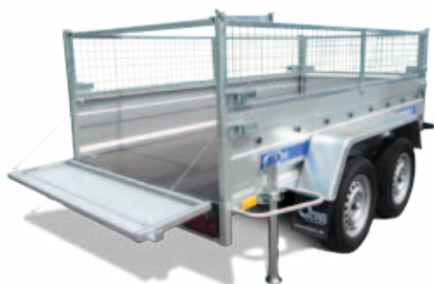
Anhänger mit Laubgitteraufsatz