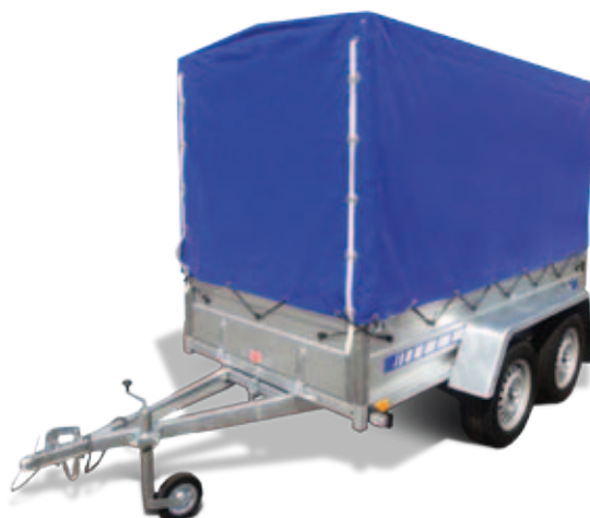
Plane mit Spiegel