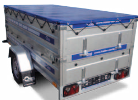
Anhänger mit Bordwanderhöhung und Flachplane