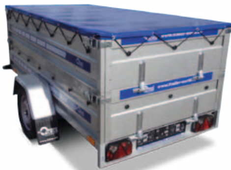
Anhänger mit Bordwanderhöhung und Flachplane