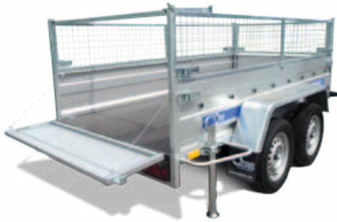
Anhänger mit Laubgitteraufsatz